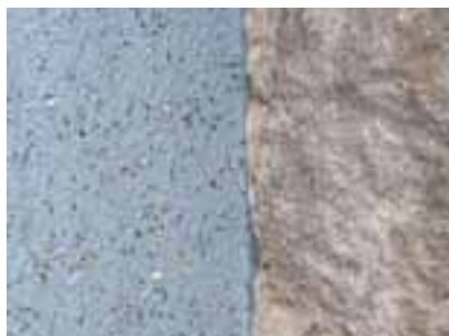
Stolit Effect u harmoničnoj kombinaciji s prirodnim kamenom