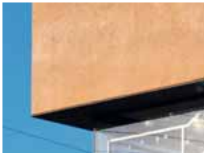
Površine s individualnom osobnošću